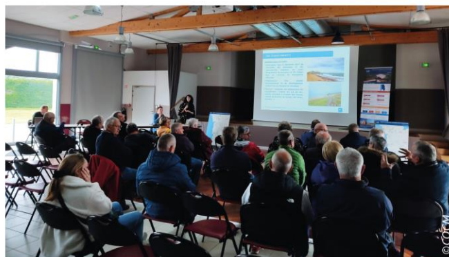
Réunion publique - Créances - 12 avril 2023

Ces temps d'échanges sont essentiels à la procédure, ils permettent d'alimenter les productions et d'assurer une cohérence des documents avec le cadre législatif et avec l'ensemble des plans et programmes.