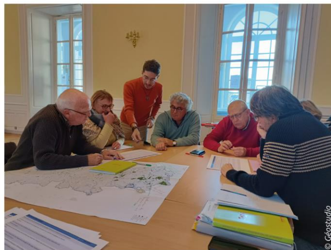
Atelier Diagnostic «Environnement» - 17 novembre 2022

Durant le dernier trimestre 2022, plusieurs temps d'échanges avec les élus ont été organisés. Ces ateliers avaient pour objectif de définir ensemble les enjeux du territoire notamment en matière de logements, de mobilité, d'activités économiques, d'environnement (préservation et valorisation de la biodiversité, la prise en compte des risques). Les élus ont partagé leurs connaissances du territoire permettant d'alimenter les diagnostics.