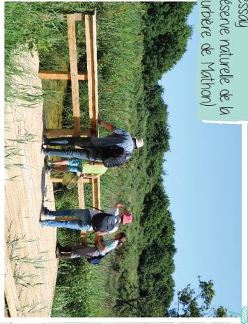
Lessay (Réserve naturelle de la tourbière de Mathon)

Puis d'information dans la Carte vélo disponible dans les lieux d'informations habituels ou sur www.coccm.fr et www.tourisme-coccm.fr