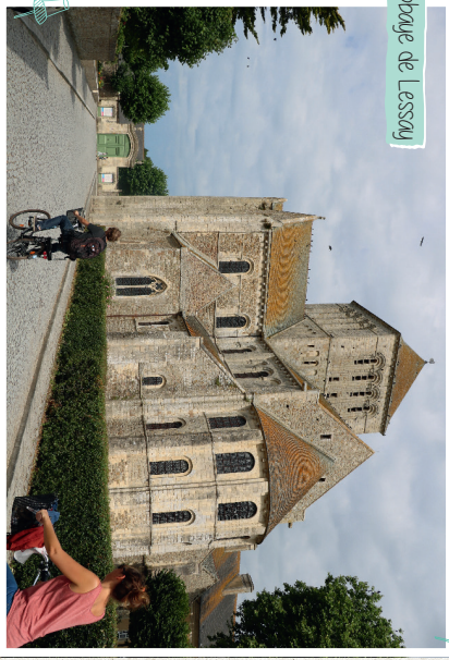
Abbaye de Lessay

A - Lessay Tous commerces, restaurants, banque, bureau de poste, aire de pique-nique... A voir : Abbaye de Lessay, Laiterie du Val de l'Ay (payant), Réserve naturelle de la tourbière de Mathon (sur réservation/payant) B - Vesly Multi-commerce/ presse, café/bar, aire de pique-nique, terrain de pétanque A voir : Eglise Saint-Pierre, Chapelle Notre-Dame-de-la-Consolation, Borne de la 2 ème Division Blindée